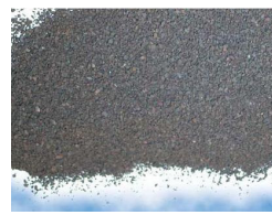
Óxido de Manganês