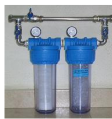
Filtros para potabilização de Água