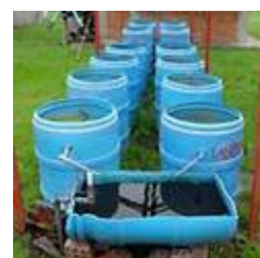
Filtros lentos para uso animal e humano