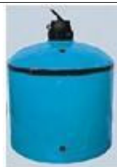
Filtro de Fibra