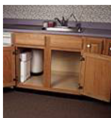
Retirada de gosto de cloro