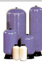
Filtro de Troca Ionica